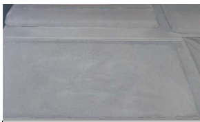
Sauberkeit, B08 - 2008 - huile sur toile - 110x90