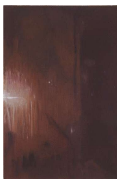
Eingang (Entrée) 4-5, B08 - 2008 - huile sur toile - 120x80