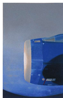
Eingang (Entrée) 5-5, B08 - 2008 - huile sur toile - 130x85