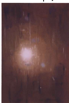
Eingang (Entrée) 1-5, B08 - 2008 - huile sur toile - 120x80

Les déplacements, ce sont aussi ceux opérés lors des différents recadrages auxquels se livre l'artiste. Les cadrages serrés sur des détails comme ce réacteur ou de façon plus énigmatique les drapés de Sauberkeit, B08, ou encore la peau tannée de Idée 1, perdent le spectateur. « Que se passe-t-il dans ces moments privilégiés où un détail se voit ? De quelle surprise ces moments sont-ils porteurs ? Que fait celui qui regarde « de près » et quelle « récompense » imprévue cherche-t-il ? interroge Daniel Arasse » dans la préface de Le détail (Pour une histoire rapprochée de la peinture Ed. Champs, Flammarion p7).