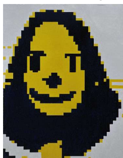
Geist 6 (Esprit) , B08-2008 huile sur toile - 90x70

Les sujets de la peinture sont multiples, allant de façades d'immeubles à des drapés, en passant par des visages modélisés comme celui de Giest 6 , ou encore un grillage. On peut établir, pour cette indifférenciation au sujet, une relation avec Gerhard Richter. « La peinture ne sert plus désormais à montrer directement le visible ; elle cherche davantage à interroger le réel et ses images » (Christophe Domino L'art contemporain ed. Scala p34). Heberhard Havekost inscrit son travail dans une tradition picturale qui interroge le rapport de l'image au réel.