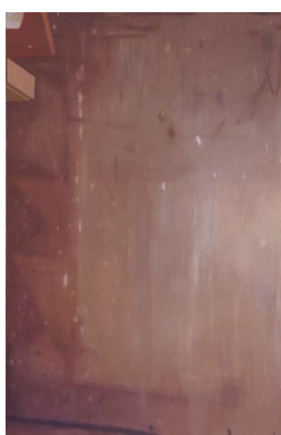
Eingang (Entrée) 3-5, B08 - 2008 - huile sur toile - 130x85