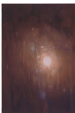
Eingang (Entrée) 2-5, B08 - 2008 - huile sur toile - 120x80