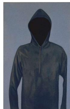
Geist 5 esprit, B08 2008 - huile sur toile - 130x80

Les manipulations successives des images conduisent à une accentuation de l'écart avec le réel. C'est cette distanciation qui est au cœur du processus créatif. Le travail de cadrage, de recadrage en fait également partie. On le mettra en relation avec le travail sur les seconds plans ou les fonds qui abstraient un peu plus l'objet de son environnement. On pourra rapprocher cette démarche de celle du photographe Thomas Demand qui réalise des maquettes d'espaces de bureaux pour en faire des photographies.