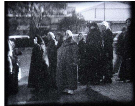
A une passante