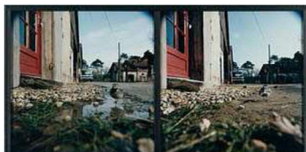
N°91, novembre-décembre 1990 – cibachrome – 73x150 – Paris, M.A.M. Ville de Paris

d'exposition Tête d'or MAC Lyon). Les prises de vue sont le résultat d'une construction qui réclame la participation de l'oiseau mais aussi des autres éléments environnants ou de la météorologie comme en témoigne le diptyque N°91, novembre-décembre 1990. Dans ces œuvres le scénario est préétabli comme dans les photographies scénographiées de Jeff Wall.