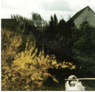
N°41, mai 1986 photographie couleur, épreuve type « C » - 100x100 – Centre National des arts plastiques, FNAC.

perspective et la mise au point classique en refusant la clarté ou la lisibilité des relations spatiales.