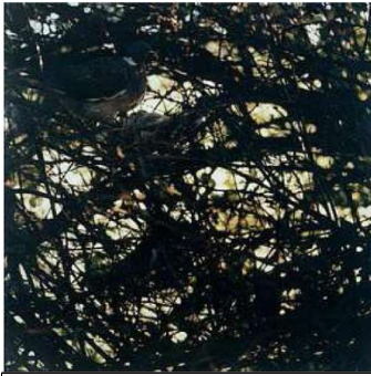
N°30, août-septembre 1981 - cibachrome – 185x185 - Paris, M.A.M. Ville de Paris

La relation à la peinture, on la retrouve également presque sous forme de citation dans l'œuvre N°30, août-septembre 1981. Le réseau très dense des branches évoque les linéaments des dripping de Jackson Pollock et produit un all over. Le pigeon se perd dans cette imbrication et n'est plus qu'un élément plastique parmi d'autres. Dans l'œuvre N°4, août 1979, ce sont des relations de formes qui existent entre la courbe d'un toit et celle de la queue de l'oiseau, ou encore des relations chromatiques entre les couleurs du plumage ou celles du bois. Dans d'autres œuvres on pourra rechercher ces relations, cette harmonie qui caractérise ces photographies.