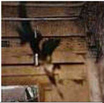
N°6, août 1979 – photographie couleur, épreuve type « C » - 85x85 – Centre National des arts plastiques, FNAC.

Cette question est à l'œuvre ici de façon tout à fait perceptible et dans l'image et dans le titre. « L'instant volatil » (livret d'exposition Tête d'or MAC Lyon) peut être rapproché de ce que Henri Cartier-Bresson appelait l'instant décisif, être à l'affût du monde pour en saisir les instantanés qui vont le révéler. Cependant ici cet instantané est le résultat d'une construction dans la durée comme l'indique le titre. Il faut donc à Jean-Luc Mylayne des semaines, des mois avant d'obtenir ce qu'il recherche. L'image n'est donc pas le fruit d'un hasard heureux ou d'un choix dans une multitude d'images comme le permet aujourd'hui le numérique. Cette lenteur, ce rapport au monde, va à l'encontre de la