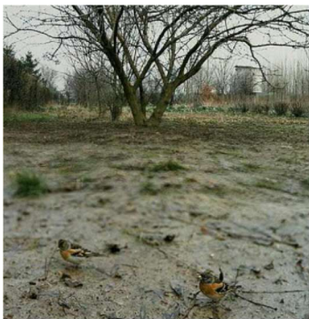
N°66, Janvier à mars 1987- photographie couleur marouflée sur aluminium –85x85 – Saint- Etienne, MAM