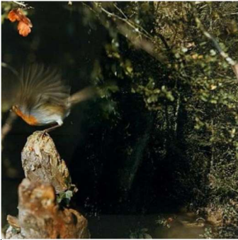
N° 8, septembre 1979 – photographie couleur marouflée sur aluminium - 100x100 – Saint- Etienne, MAM

identifiée par un numéro d'ordre et une période et tirée en un seul exemplaire. La question de l'unique et du multiple est ici posée.