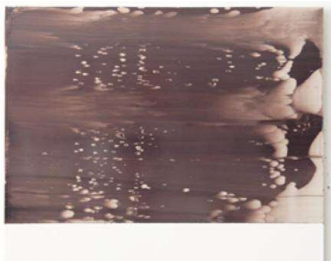
Spectral B 12, 2006 - Acrylique sur PMMA - 48 x 55 cm

mm d'épaisseur, il offre des qualités de résistance, de résistance à la touche notamment. Ce matériau dur se prête au travail gestuel et de masquage auquel se livre l'artiste tout autant qu'aux multiples passages (2 à 300 pour la série de Etendue). Le choix du support est une des questions qui peut être soumise aux élèves de second cycle. A titre exploratoire, il est possible d'en voir l'incidence sur la réalisation de l'image, par exemple en passant de la toile au papier, au bois et aux plastiques. Mais le support peut tout aussi bien être l'objet d'expérimentations au collège. En terme d'histoire des arts on pourra introduire des connaissances sur le passage de la peinture sur bois à la peinture