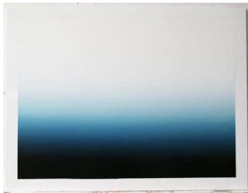
Etendues 08, 2008 - Acrylique sur PMMA - 90x118x2

Il joue un rôle fondamental dans ce travail. Le PMMA ou polyméthacrylate de méthyle (en anglais Polyméthyl Methacrylate, plus connu sous le nom de plexiglass) est un matériau qui se décline en surface opaque transparente ou réfléchissante, blanche ou de couleur. C'est pour ces qualités entre autres que Rémy Hysbergue va l'utiliser. Assez épais, il l'utilise en 10 à 15