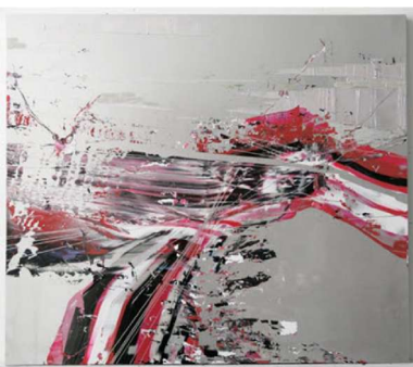
Pour l'instant 39, 2006 - Acrylique sur PMMA - 138 x 121 x 6 cm

La couche picturale joue un rôle essentiel. Le processus d'application est tout à fait visible, Rémy Hysbergue va jouer avec les caractéristiques physiques de la peinture, la non miscibilité des liants produit des effets spontanés qui dynamisent la surface. Les procédés : gestion précise des temps de séchage, superposition des couches non miscibles qui dans le frais vont interagir, intervention physique, conjugués au choix des couleurs vont produire des effets de