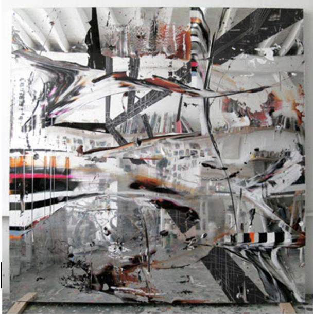
Pour l'instant 21, 2006 - Acrylique sur PMMA - 200 x 200 x 6 cm

près et de loin que l'on a des œuvres. Ainsi en va-t-il pour Etendue 09 qui laisse apparaître un accident de la couleur. Dans ce « presque rien » du dégradé de couleur une vision rapprochée de la peinture permet de voir ce qui distingue les deux œuvres juxtaposées, Etendue 08 et Etendue 09.