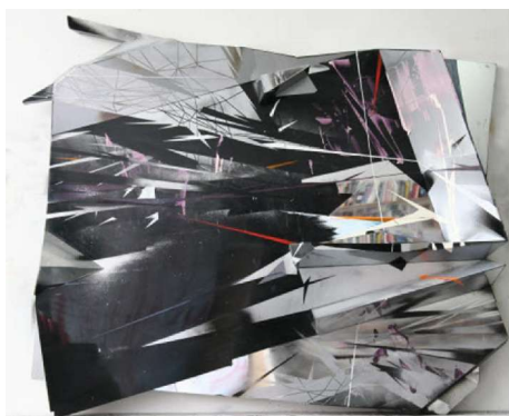
Furtifs 02, 2009 - Acrylique sur PMMA - 135 x 165 x 25 cm

Ce déplacement du spectateur est aussi important pour appréhender la présence physique de l'objet tableau. Pour Rémy Hysbergue un tableau est comme un visage, on ne peut le réduire à la seule vue de face, il faut tourner autour. Cette matérialité du tableau est à mettre en relation avec la démarche d'Ellsworth Kelly qui « veut occuper les trois