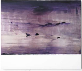
Spectral B 14, 2006 - Acrylique sur PMMA - 48 x 55 cm

Certaines pièces se rattachent au principe du all over, la peinture est appliquée