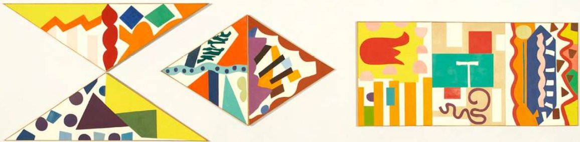
Malibu -1978/1979 - huile sur toile en 7 parties. 190 x 525 cm.

Les formes s'imbriquent, s'emboîtent, s'enchevêtrent, s'associent, s'emmêlent mais sans jamais véritablement donner l'impression que l'une vient masquer l'autre dans ce qui serait alors la retranscription d'un espace en trois dimensions. Les formes elles aussi affirment la frontalité du tableau.