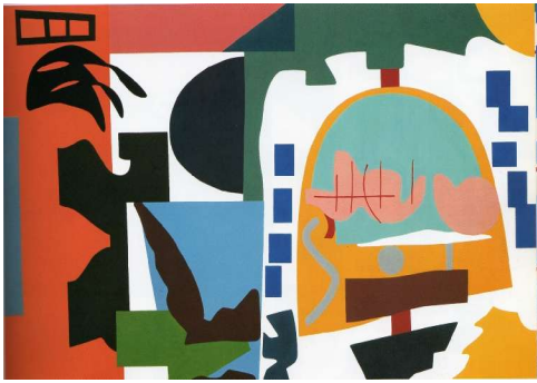
Basilique , 1994 - Huile sur toile, - 138 x 220 cm - Galerie Nathalie Obadia, Paris.