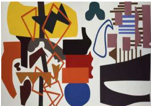
La Boule Bleue - 1992/93 - Huile sur toile - 137 x 240 cm – collection particulière

Les œuvres de Shirley Jaffe sont à envisager avec les élèves comme des espaces dont la littéralité est un élément si ce n'est l'élément prépondérant. C'est à l'intérieur de