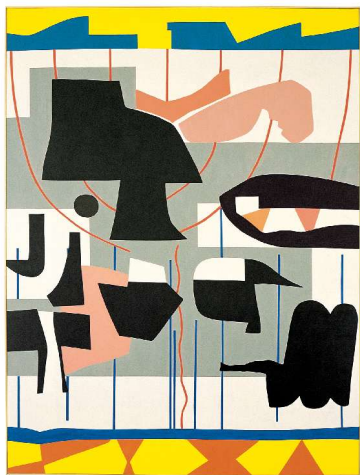
remembering whistler - 1999 – huile sur toile – 200x150 – FRAC Auvergne.